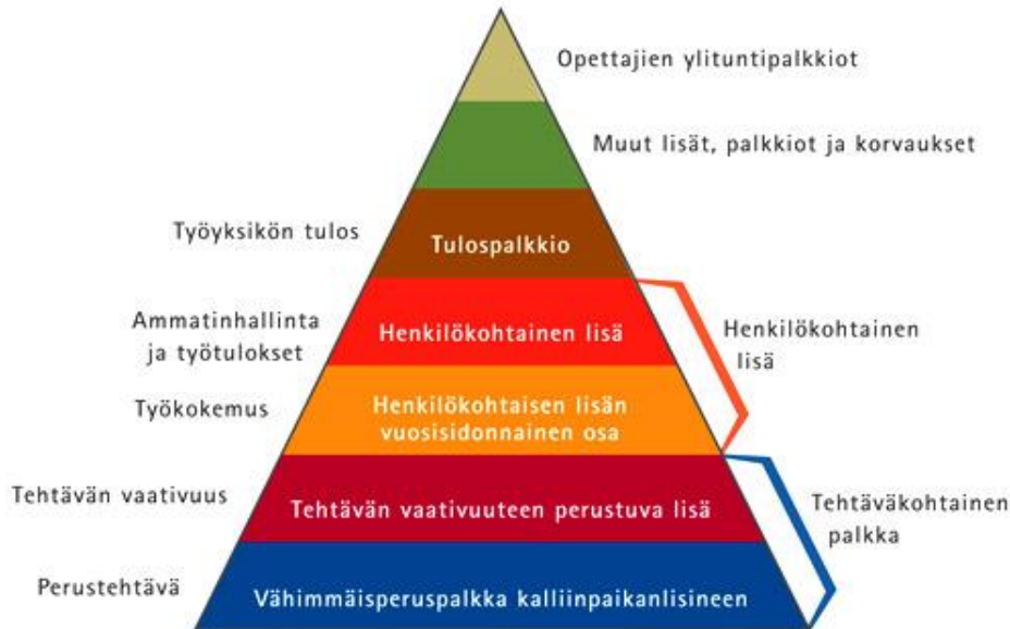
Kuvio: Mistä opettajan palkka muodostuu